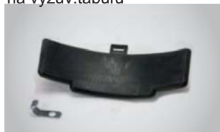
PN: 1695 106 152 Plastová ochrana pre montáž/demontáž ráfika