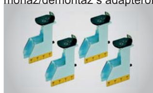
PN: 1695 103 543 Sada 4ks na motocykle