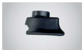
PN: 1695 102 725 Ochrana montážnej hlavice