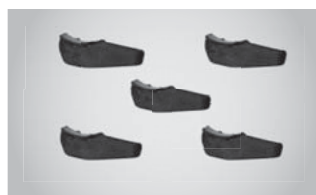
PN: 1695 101 608 Plastová ochrana pre montážnu hlavicu