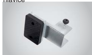
PN: 1695 101 518 Pre motocyklové kolesá