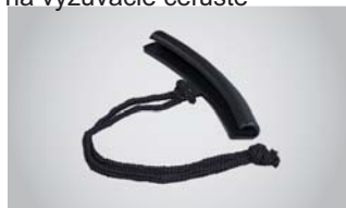
PN: 1695 105 191 Plastová ochrana pre ráfik