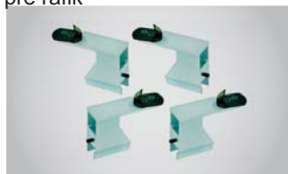
PN: 1695 103 542 Sada 4ks na skútre