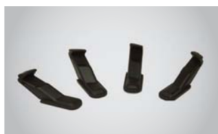
PN: 1695 101 402 Ochrana pätiiek na vyzúv.tabuľu