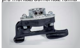
PN: 1695 103 210 Hlavica pre motocykle