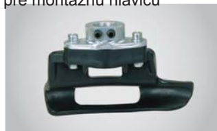
PN: 1695 103 211 Plastová hlavica pre monáž/demontáž s adapterom