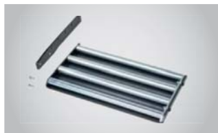
PN: 1695 106 190 Valčeková doska