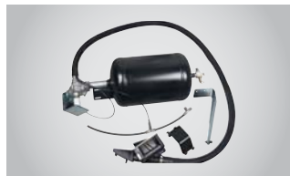
PN: 1695 108 913 Externý prístroj na hustenie