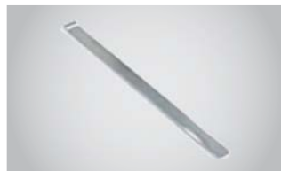
PN: 1695 108 871 Montážna páka (WDK modely)