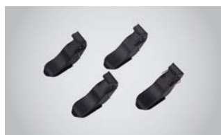
PN: 1695 101 502 Plastové ochrany na vyzúvacie čeluste