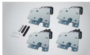
PN: 1695 101 575 Sada 4ks pre motocykle/skútre