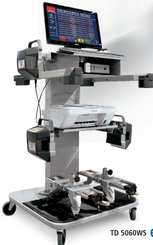
TD 5060WS Bluetooth