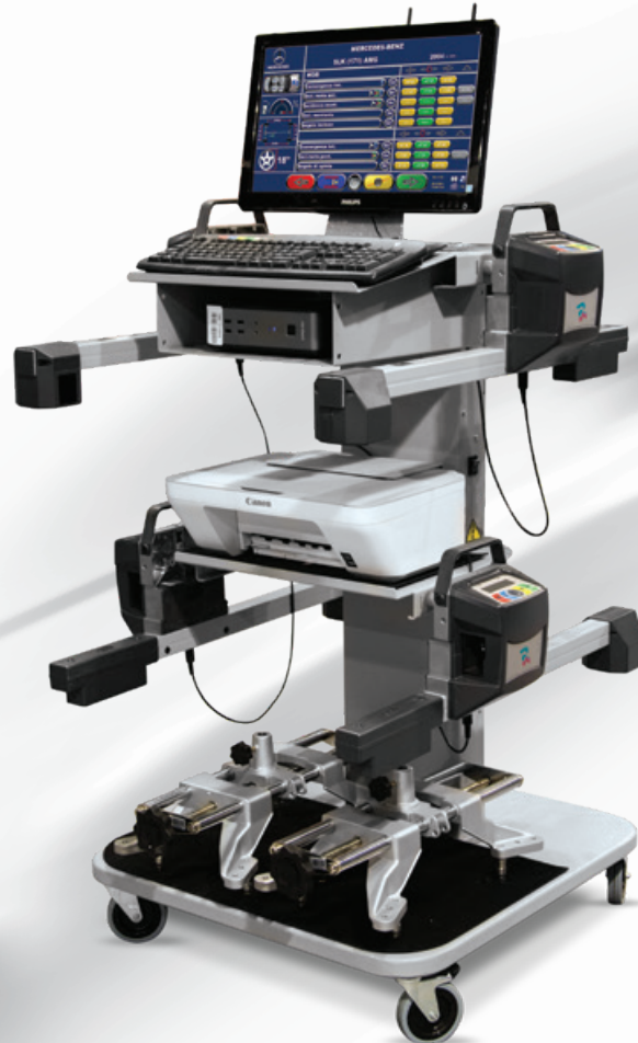
TD 5080WS Bluetooth