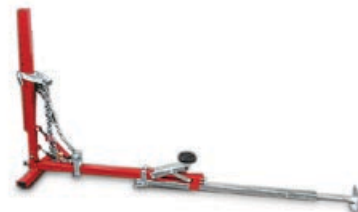
Art. 07700200 | Kit prolunga con tampone Kit extension for underbody without sills including rubber pad