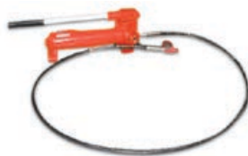
Art. 07700100 | Kit pompa 4 ton. Con tubo ad alta pressione Kit with hydraulic pump including high pressure hose.