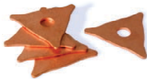
Art. CS002000 | 20 pz/pcs Art. CS003000 | 50 pz/pcs Art. CS004000 | 100 pz/pcs Art. CS005000 | 1000 pz/pcs Confezione rondelle ramate a tre punte Pack 3-angled copper plated washers