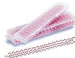
Art. 172 | 30 pz/pcs Art. 173 | 50 pz/pcs Art. 174 | 100 pz/pcs Confezione fili ondulati per saldatura Wiggly wires packages