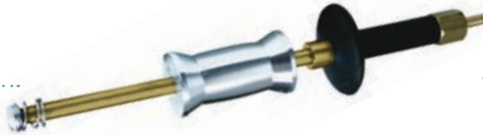
Art. 171Q | Martello ergonomico M14 con impugnatura per spotter M14 brass slide hammer with handle for spotter